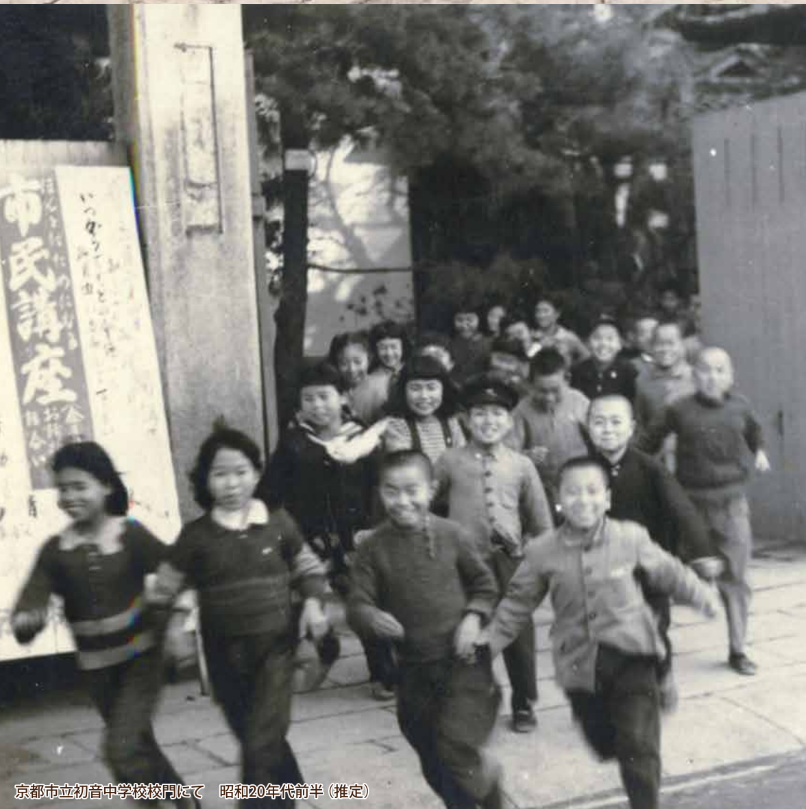
京都市立初音中学校校門にて 昭和20年代前半(推定)