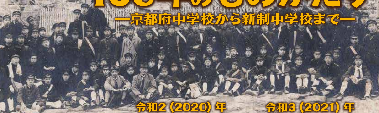
修学旅行写真(京都府立京都第一中学校) 大正10(1921)年5月18日