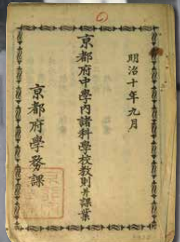
京都府中学内諸科学校教則並課業 明治10(1877)年9月