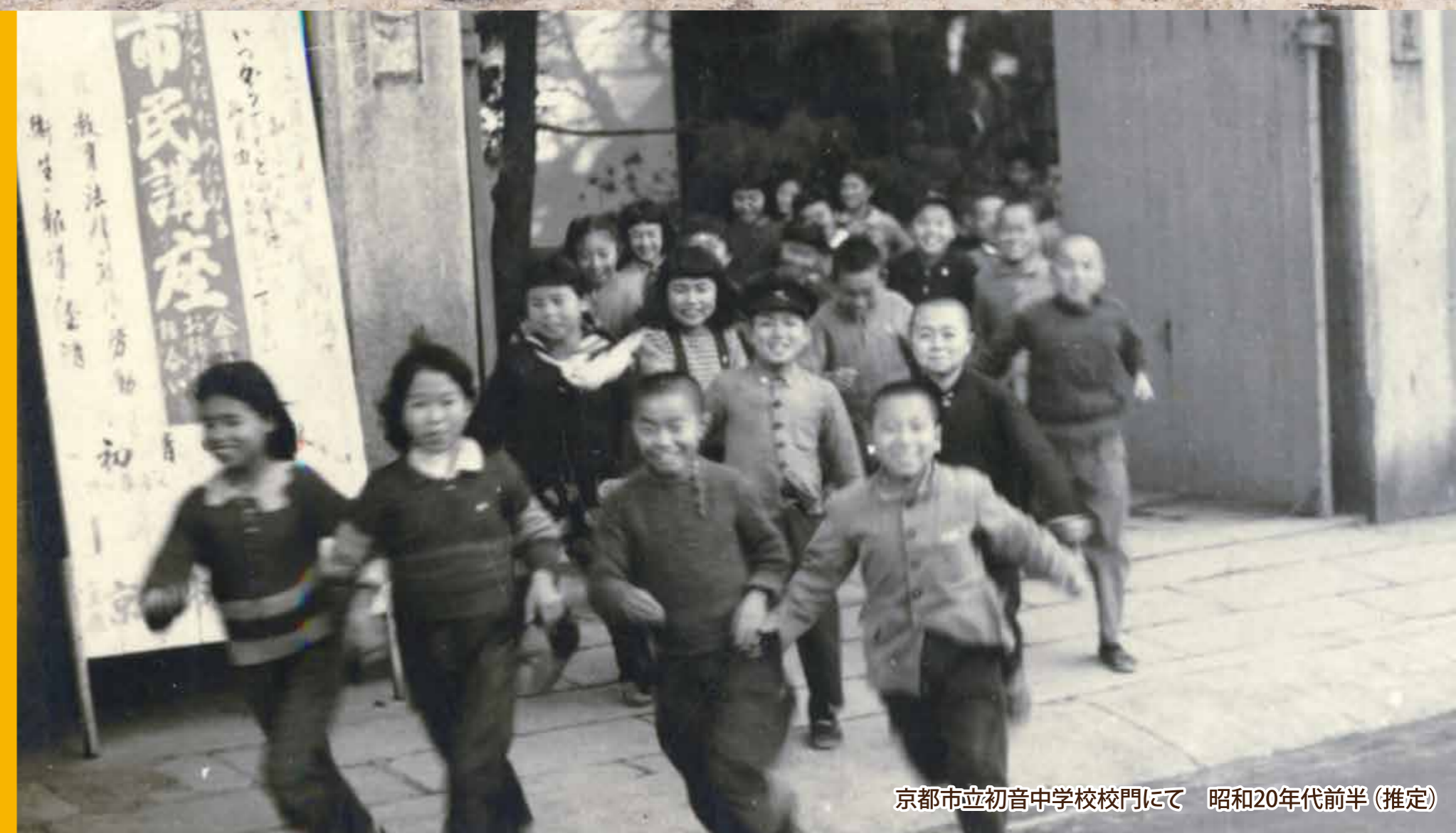
京都市立初音中学校校門にて 昭和20年代前半(推定)