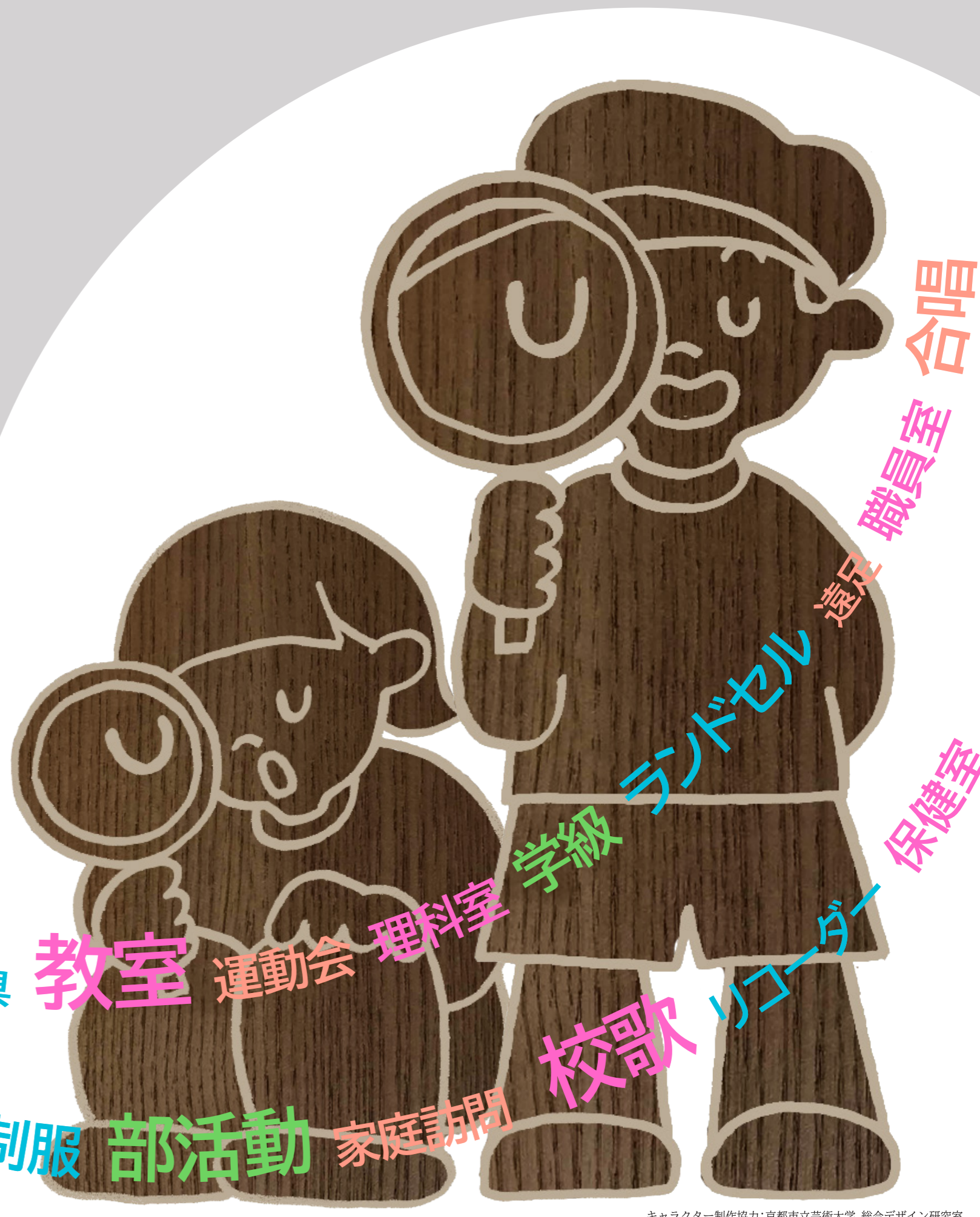
キャラクター制作協力:京都市立芸術大学 総合デザイン研究室

昇降口 給食 学芸会 時間割 卒業式 校則 校庭 生徒会 筆記用具 教室 運動会 理科室 学級 ランドセル 遠足 職員室 合唱 校舎 通知表 PTA 家庭科室 夏休みの宿題 修学旅行 制服 部活動 家庭訪問 校歌 リコーダー 保健室