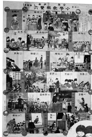
巖谷小波案 尾竹国観画 《小学教科双六》明治40年