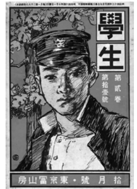
『学生 第2巻第11号』明治44年発行