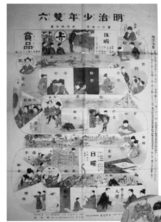
巖谷小波案 武内桂舟画 《明治少年双六》明治31年