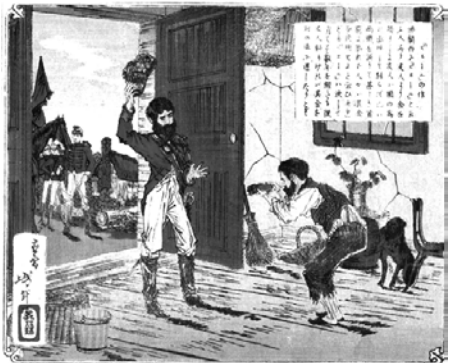
月岡芳年《錦絵修身談 ピエールの信》明治17年 7月4日～8月19日展示

近代になると、多くの学校が創設され、児童向け雑誌が次々と創刊されるなど、子どものための文化が一斉に花開きました。画家や文筆家など、当時に代表する文化人は、「子どもにこそ良い文化を」と考え、学校に絵画を寄贈したり、自らが主導して美しい挿絵の入った雑誌を発刊したりしました。本展では、そうした大人から子どもたちへのメッセージのつまった作品として、学校に寄贈された、動物や歴史人物などが描かれた絵画、明治期の児童雑誌や付録のすごろくなどを紹介します。昔の子どもたちを魅了した、楽しく学べる絵画をぜひご覧ください。