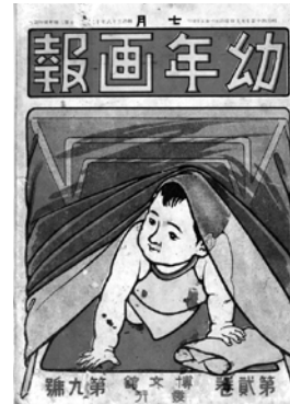
『幼年画報 第2巻第9号』明治40年発行